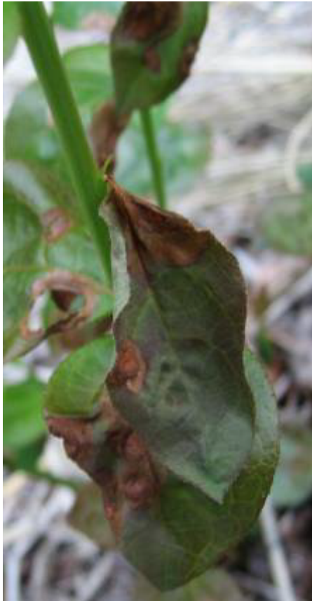
写真1 新梢葉の葉枯れ症状