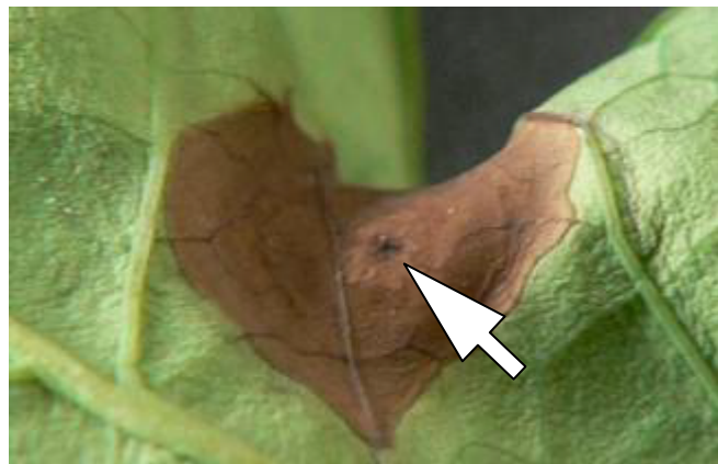
写真3 病斑中心にみられる黒褐色の突起物 (葉に感染した分生子)