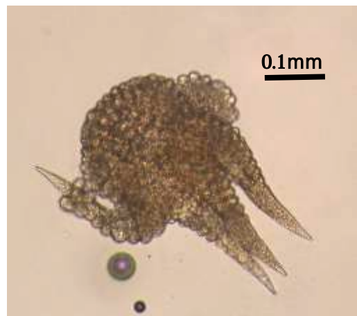
写真5 分生子の顕微鏡写真 (付属器を閉じた飛散時~付着時の形態)